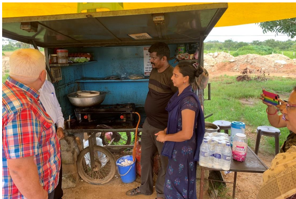
Mobilní stánek na výrobu čapátí (placek) s náplní.

Na druhé straně mě zasáhl příběh paní, jejímž dětem je z darů placeno školné. Důvodem je dialýza, kterou paní pravidelně absolvuje. V těchto krajích to obvykle znamená jasný rozsudek s konečnou prognózou (transplantace jsou drahé a jen pro bohaté). Pravidelnou práci žena mít nemůže, pouze drobné přivýdělnky. Manžel pracuje ve vedlejším městě jako taxikář, domů se dostane jednou dvakrát za měsíc. Velkou zásluhou dárců tak děti budou mít lepší vzdělání a tedy i budoucnost.