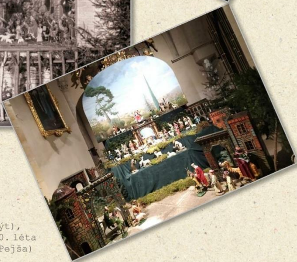
foto 1946 (Ladislav Kamarýt), 1969 (Aleš Kraus), 70. - 80. léta 20. stol, 2023 (Jaroslav Pejša)